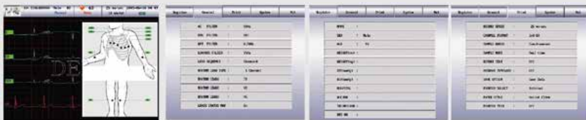
Lead indicador de estado